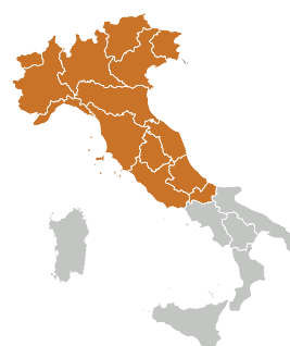
ZONA DI COLTIVAZIONE